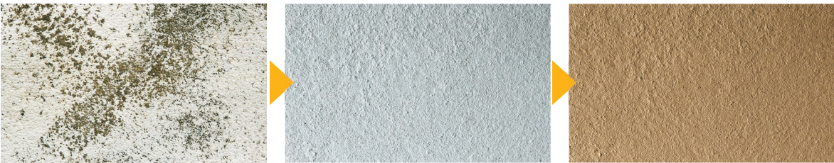
Abgewitterte Dispersionsfarbe Grundbeschichtung/Überbrückung der Altbeschichtung mit KEIM Contact-Plus Zwischen- bzw. Schlussbeschichtung mit KEIM Granital®