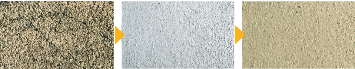
Altputz mit Rissen Grundbeschichtung/Rissverschlämmung mit KEIM Contact-Plus-Grob Zwischen- bzw. Schlussbeschichtung mit KEIM Granital®